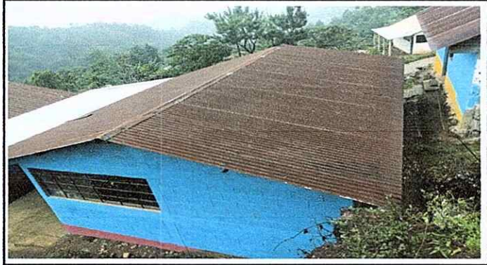
Foto 2: cambio de lamina, por lamina troquelada, esta deteriorada